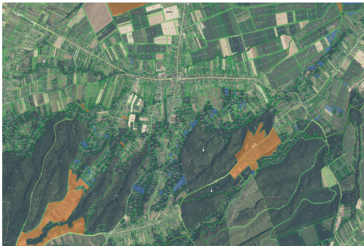
Slika 2. Katastarske čestice poljoprivrednog zemljišta u vlasništvu RH koje su određene za raspolaganje, k.o. Feričanci

Prikaz katastarskih čestica poljoprivrednog zemljišta u vlasništvu RH koje su određene za davanje u zakup na području Općine Feričanci nalazi se na slikama 2 i 3.